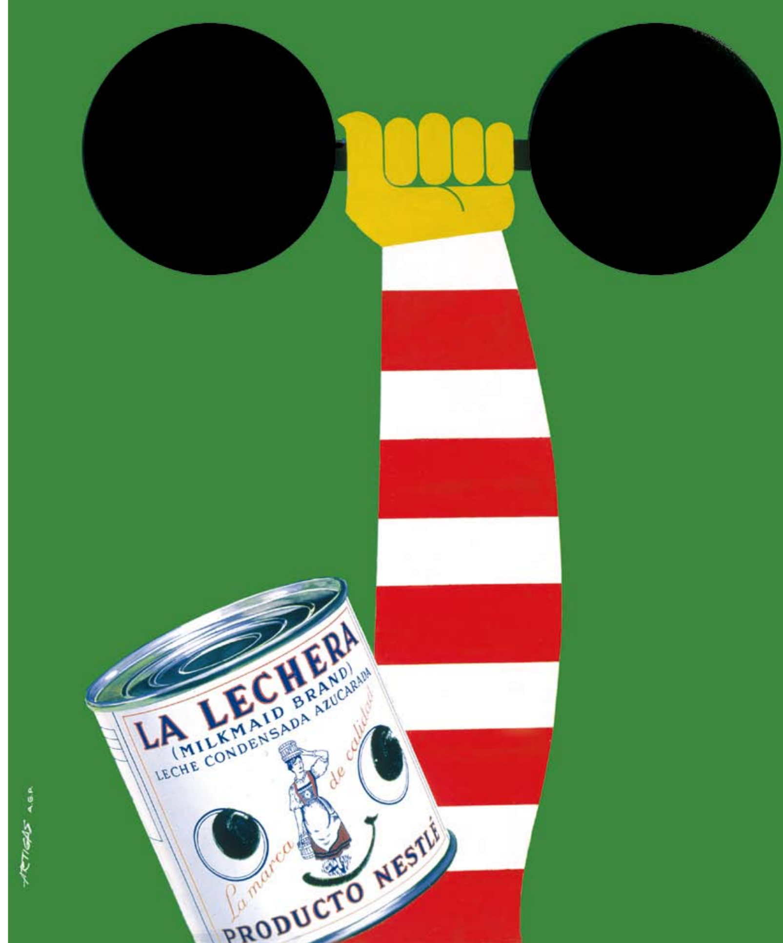
S/F. ARTIGAS. "Es notable la influencia del diseñador Paul Rand en la ejecución de las mangas de la camiseta y de las pesas en esta imagen, que es la segunda versión para el concurso Un concentrado de energías ".

Su trabajo no fue meramente plástico. Muchos se convirtieron con el tiempo en maestros de maestros, impartiendo clases, y llevaron >