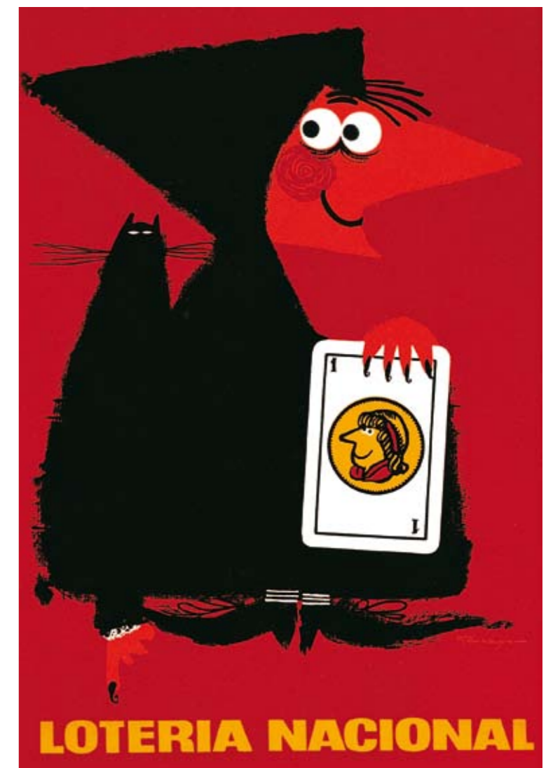
1971. GARBAYO. "Fue uno de los componentes originales del Grupo 13. Tanto el anuncio de Lotería Nacional como el de la Jefatura Central de Tráfico (s/f) son magníficos ejemplos de la aportación del diseño a la comunicación institucional".

Como no podía ser de otra manera, el diseño de marca de Renfe no ha quedado fuera de la evolución del mismo. En la exposición Grafistas se puede apreciar el desarrollo de su logo como ejemplo de comunicación institucional. De la modernidad del diseño de Vicente Gómez, que refleja la pantalla de televisión, al trabajo de Juan Toribio, en el que ya se plasma el dinamismo de la marca representada. La historia de la imagen de Renfe resume de alguna manera la del diseño gráfico en España.