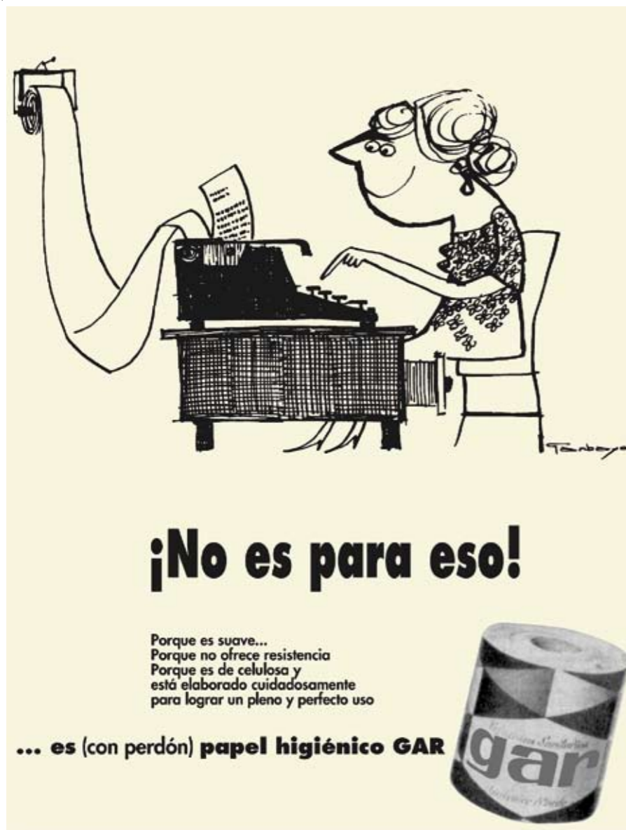
S/F. GARBAYO. "El humor aplicado al diseño tiene aquí uno de sus mejores ejemplos, con influencia del autor Saul Steinberg".