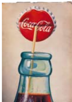
S/F. ARTIGAS. "Hasta algo tan identificado con EE UU como la Coca-Cola es susceptible de tener un toque hispano".