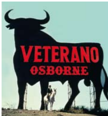
1956. PRIETO. "Esta es la versión original del célebre toro, con la tipografía rotulada".