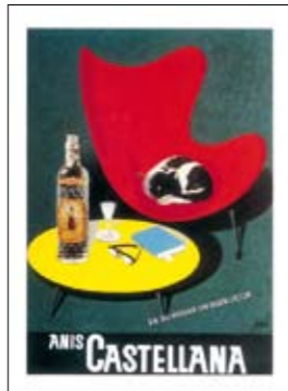
1961. PRIETO. "Aunque solo se le recuerde por el toro, Prieto tuvo una completísima trayectoria. La silla le da a esta imagen un toque de gran modernidad".