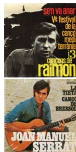
GIL Y FORNAS: "Ambos tuvieron vidas paralelas en lo profesional: trabajaron para sendas discográficas (Hispavox y Edigsa) en los años sesenta y, una década más tarde, para editoriales (Alianza/Edicions 62)".

> a cabo una gran labor intelectual. A través de sus obras, el lector revive varias décadas de la historia de España, de la autarquía al desarrollismo hasta las puertas de la transición, y cómo el diseño gráfico ha corrido paralelo a la construcción de la sociedad de consumo. Así, por ejemplo, para el pintor Luis Mayo, el anuncio de Polil de Josep Artigas que ocupa la portada del libro va mucho más allá de su incontestable placer estético: "Con un icono comercial rentable es capaz de resumir la sociedad española de la posguerra, su tono de voz, sus aspiraciones y temores: hasta su olor".