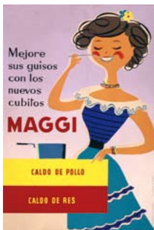
1955. ARTIGAS. "Este cartel pertenece a la época suiza de su autor. Fue de los primeros en ser reconocido internacionalmente".