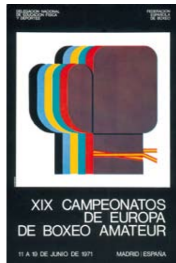
1971. SANTAMARÍA. "Destaca en este diseño el magistral empleo del color en la utilización de las tintas gráficas".