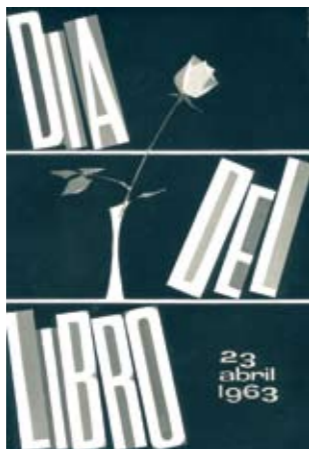
1963. MORADELL. "Los carteles anunciadores del Día del Libro son un buen termómetro de la originalidad del grafismo español".