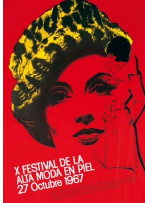
1967 ARTIGAS. "En este cartel destacaría el valor del color, cómo ilumina una tinta plana con los recursos de las tintas gráficas".