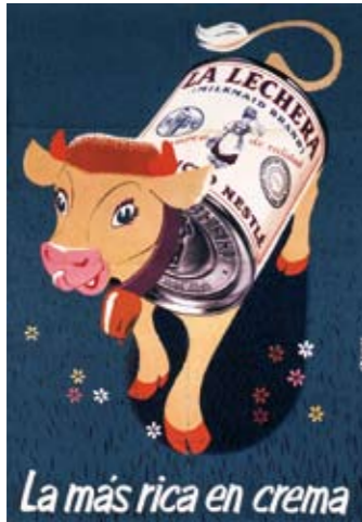
1954. ARTIGAS. "Nestlé fue de las primeras marcas en recurrir a los concursos para renovar su imagen campaña tras campaña".